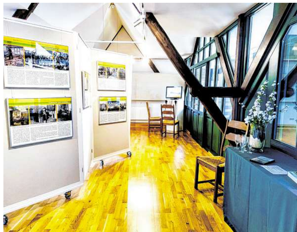
Die Sonderausstellung „Landwirtschaft und Ländlicher Alltag in Twistringen und Umgebung von 1870-1970“ ist bis zum 22. Oktober im Strohmuseum zu sehen.

Angeboten des Strohmuseums gibt es dienstags und donnerstags von 9 bis 11.30 Uhr telefonisch im Museumsbüro unter der Telefonnummer 04243/4492 sowie täglich nach einer E-Mail an info@strohmuseum.de oder auf der Internetseite unter www.strohmuseum.de .